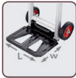
L-355 mm; Sz-240 mm