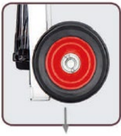
Acél + gumi; átmérője 150 mm